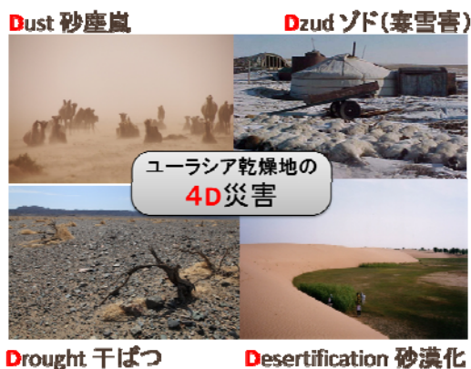
図1 ユーラシア乾燥地に特有な4種類の自然災害。

図1は、ユーラシア乾燥地に特有な4種類の自然災害を示しています。それらは、日本に飛来する黄砂の発生を引き起こす砂塵嵐、干ばつ、砂漠化、ゾドとよばれる寒雪害です。これらの頭文字をとって4D災害とよんでいます。干ばつはさまざまな自然災害のなかでも最も人的な被害が大きい災害です。4D災害を干ばつとそれから派生するものの災害群ととらえ、ひとつのリスク評価の枠組みのなかでとらえるというのが本研究のねらいです。