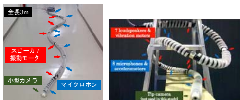
索状ロボットの概要と 3D 姿勢推定実験

(6) 索状ロボットにマイクとスピーカを交互配置し, 音によるマイク位置推定を通じたロボットの姿勢推定法を開発. 非積分型のため, 突発的な姿勢変化にも対応可能[文献 1].