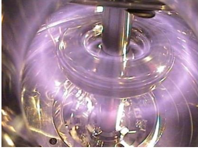
図1：RT-1 プラズマ実験装置。超伝導マグネットを磁気浮上させ、磁気圏型配位を形成して1億度を超える超高温プラズマを閉じ込める。