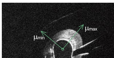
図2 SHGで観測された結晶中の異方的なキャリア輸送。

また、有機EL素子のEL発光に至るキャリア挙動の観測と解析手法の確立を目指し、2電極系積層構造および3電極系FET構造の発光素子を用いた評価を行った。まず、交流駆動下のEL発光のスペクトルの周波数依