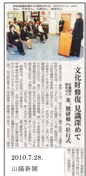
図3 インターンシップ 壮行会

インゲン市）：（派遣期間）平成22年8月2日～30日（4週間）／（研修内容）ドイツにおける現代美術作品修復技術の習得