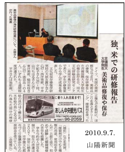
図 4 インターンシップ 研修報告会

研究を能動的に推進していくためには、自身の研究テーマに沿って自ら考え、必要な情報をいかに取得していくかが重要となる。そこで、本教育プログラムでは、大学院生に具体的な修復技能者あるいは研究者像をイメージさせるため、招聘授業とあわせ大学院 GP シンポジウムを次の通