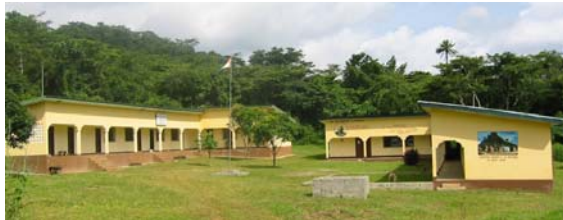
海外研究拠点での野外調査研究