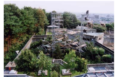
研究施設での解析研究