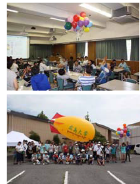
平成 29 年のイベント写真

広島大学では、飛行船型の気球を使って、空から画像を撮影して、自然を解明する研究を行っています。このイベントは昨年が記念すべき10回目で、今年は新たなスタートしての1年目です。毎年たくさんの受講生と大学での研究成果を楽しく、分かりやすく体験してもらいイベントとなっています。まず、午前中は衛星や飛行機にのせられた様々なカメラの仕組みを分かりやすく講義します。講義中には、インターネット地図「Google earth」や立体メガネ、サーモグラフィー等を使って手を触れないで「いろ」や「温度」を計るしくみを体験してもらいます。午後には、「カール爺さんの浮力実験」(右上写真)や、気球(右下写真)による空中写真撮影も行います。