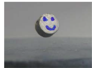
超伝導体の上で 浮遊する磁石