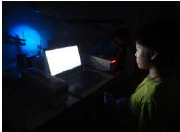
写真(左):実験・実習②、写真(右):実験・実習③