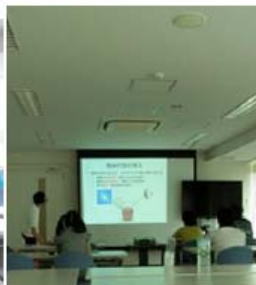
写真(上):開講式と科研費の説明、写真(左下):講義① 写真(右下):講義②。