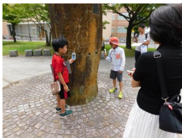
(身の回りの放射線の測定)

口頭発表の時間を設け、放射線測定器を使い測定した結果、放射線についてわかったこと、参加した感想を受講生ひとりひとりが発表した。プログラムの様子を下の写真に示す。