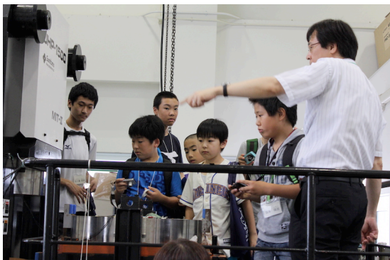
キャンパスツアーの様子