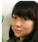
話し合い担当 ユイお姉さん