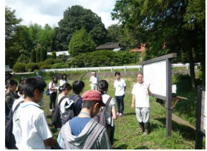
羽田保存会の方々との交流会