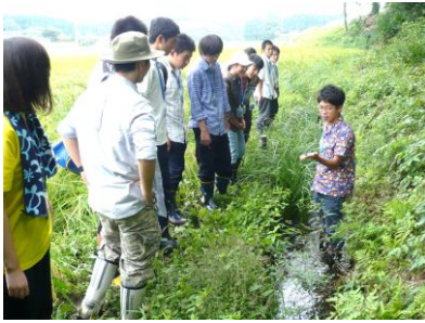
羽田ミヤコタナゴ生息地保護区①