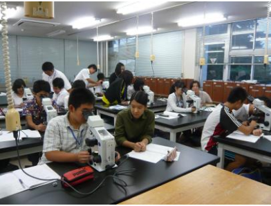
染色体標本の観察②