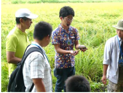
羽田ミヤコタナゴ生息地保護区②