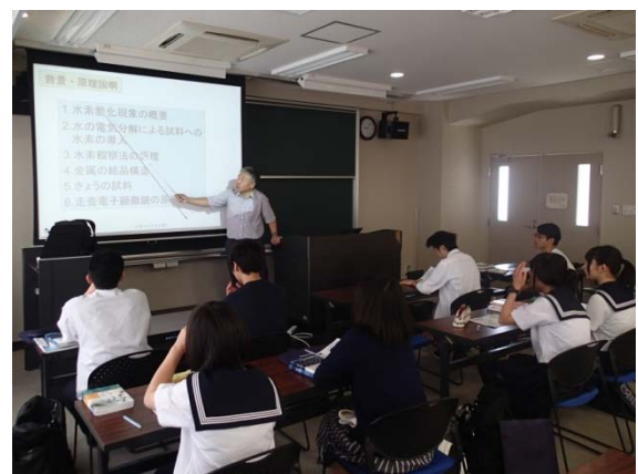
写真1 科研費制度と研究背景についての講義

1. 実施者から、科研費制度や研究の背景(写真1)、当日の実施内容の概要について、約1時間講義した。背景では、今なぜ水素が注目されているかを、地球温暖化、水素燃料電池自動車など関係付けて説明し、その後、水素を利用するには容器や配管など金属材料が必要となり、一部の金属材料は水素に触れるともろくなる水素脆化現象を示すことを説明した。そして、金属中のどこに水素がいるのかを観ることが、この水素脆化の防止に