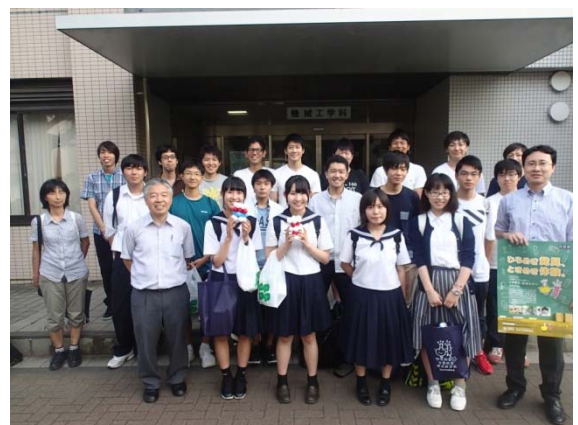
写真 6 集合写真