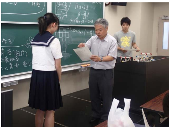
写真 5 未来博士号修了証授与式