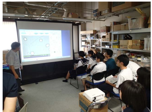
写真 4 電子顕微鏡観察結果の解説

5. 質疑応答、アンケート記入、未来博士号の修了証書授与(写真 5)、記念撮影(写真 6)を行った。