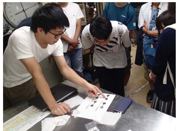
写真 3 引張試験後の試験片を観察