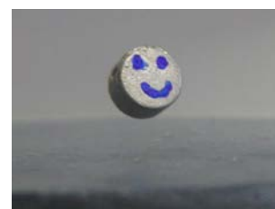
超伝導体の上で 浮遊する磁石