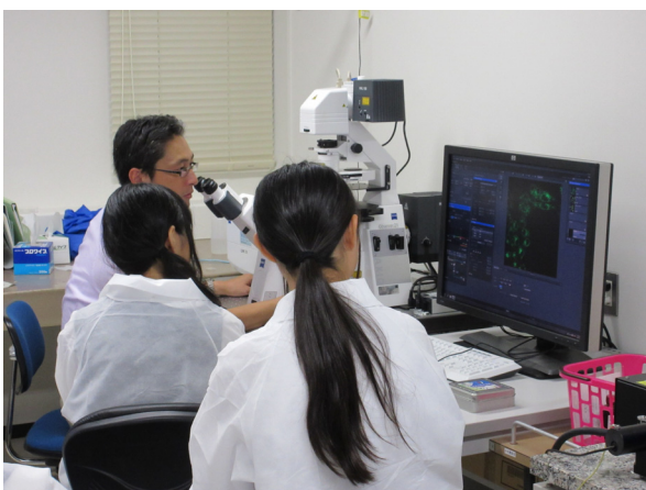
リポソームや細胞膜の共焦点顕微鏡観察