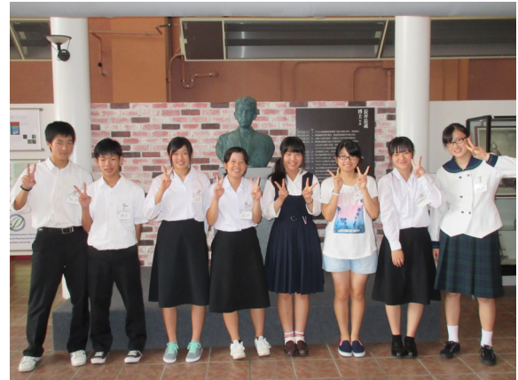
スタジオプラザでの記念撮影