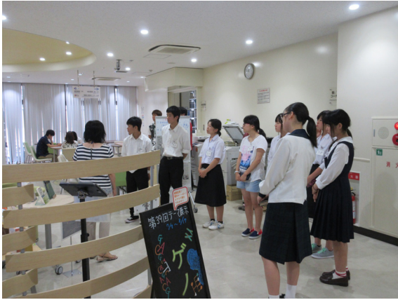
大学図書館の見学