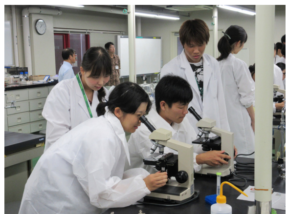
巨大リポソームの顕微鏡観察