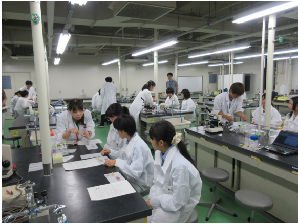
リポソーム脂質薄膜の作成