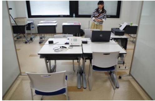
(脳波計測コーナー内の様子)

開催日はオープンキャンパスと同時開催であったが、本プログラムを開催するための適切な教室配置、関係部署との調整が行われた。8月より本学ホームページに掲載、チラシ配布により広報を行うなど、地域への広報活動は中高生の夏休みから始めたが、参加申込者数は予定にまで達せず、当日欠席もあり、チラシの配布広報活動は、早い時期から必要だったとの反省がある。