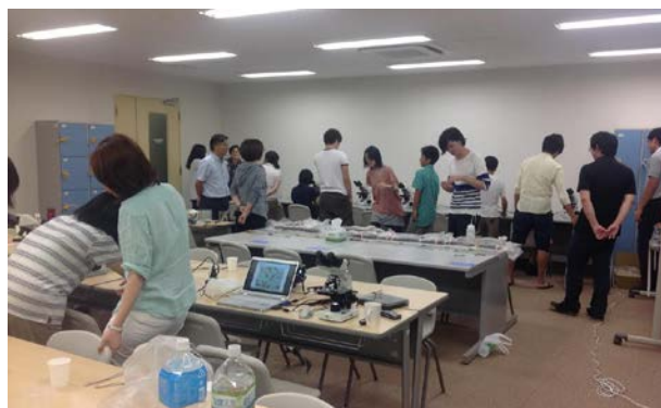
科研費についての説明風景