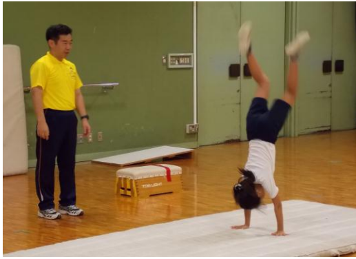
各人の目標に向かってチャレンジ(マット)