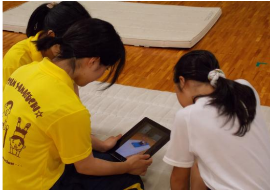
自分の技を動画でチェック