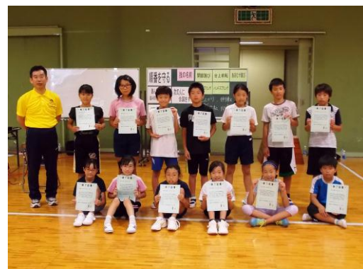
全員に未来博士号が授与されました