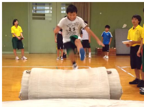
各人の目標に向かってチャレンジ(跳び箱)