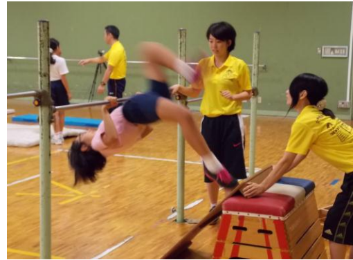
各人の目標に向かってチャレンジ(鉄棒)