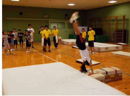
発表会(みんなの前で試技)