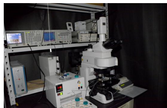
誘電泳動実験装置