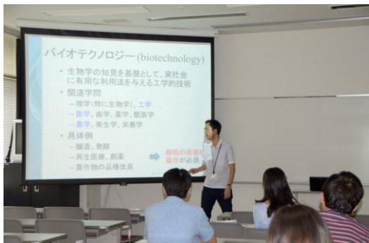
バイオ・ナノ科学における最先端の静電気技術

今回、初めて“ひらめき☆ときめきサイエンス”のプログラムを実施したが、講義や実験の内容、時間の配分など、いくつかの点で改善すべき点が明確になった。これらの経験を今後の活動に生かしたいと考えている。最後に、本プログラムの実施にあたり、実施協力者である大学院生諸氏は真面目に取り組み、期待以上の役割を果たしてくれたことに感謝している。