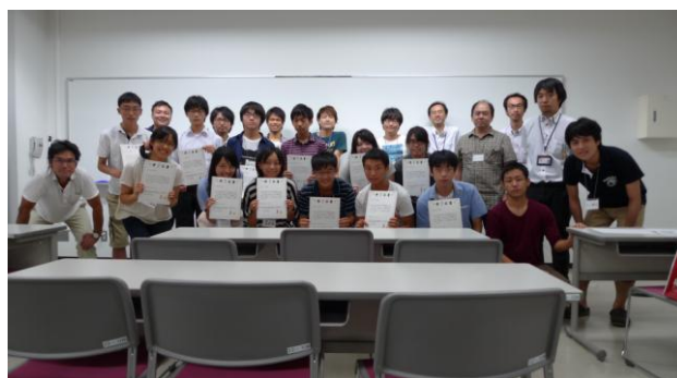
プログラム終了後の記念撮影