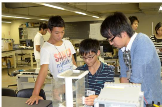
薬品の調合(磁気分離実験)