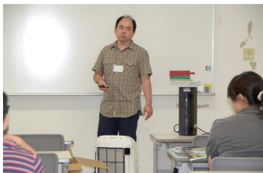
プラズマを用いた空気や水の浄化技術