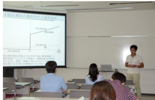
超伝導と環境応用