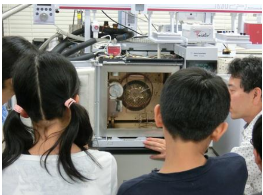
機械の説明を熱心に聴く受講生