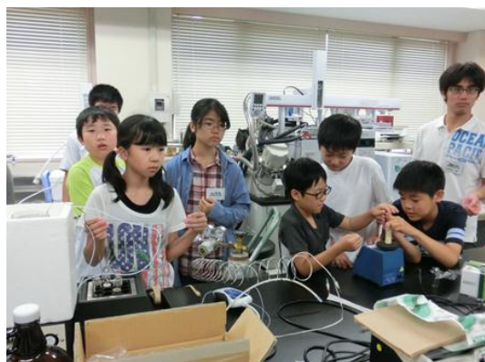
尿の揮発成分を濃縮管に捕集