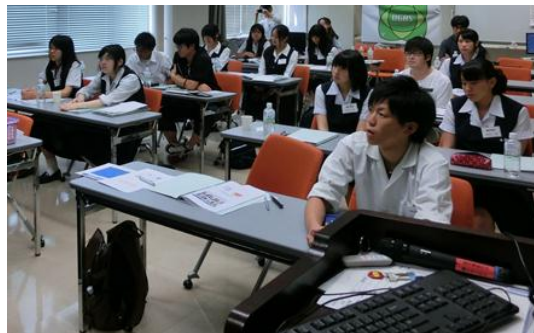
ディスカッション風景