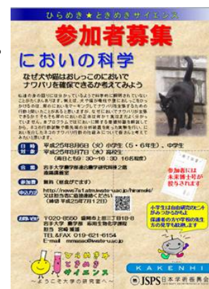
自前で作成したポスター