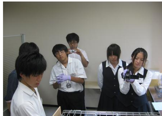
8月6日の行動試験の様子