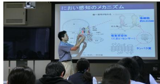
嗅覚受容体のモデルを使った説明風景

においを嗅げないとグレープジュースとオレンジジュースの味が識別できなくなることを身をもって体験してもらいました！