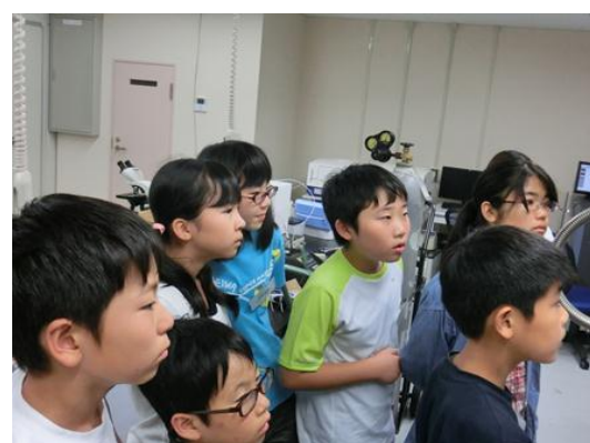
機械の動作を熱心に見守る受講生