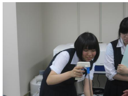
ネコの尿を正確に測り取る