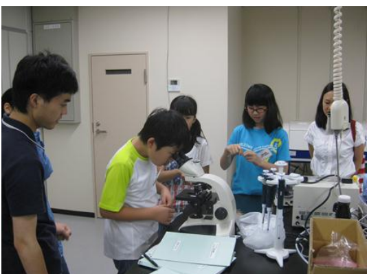
鼻腔の中の構造を顕微鏡で観察