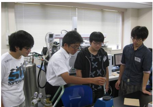
尿と試薬を初めて使う機械で混合