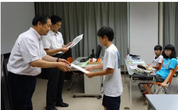
農学部長から未来博士号の授与(8月6日)