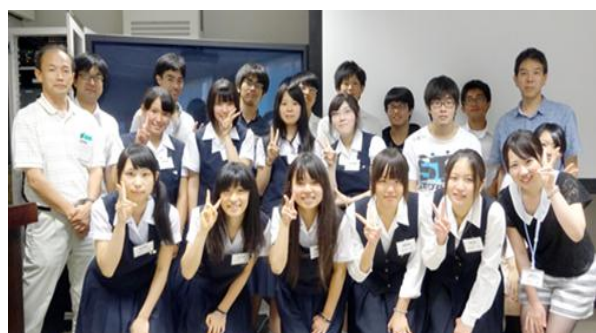
8月7日参加者と記念撮影