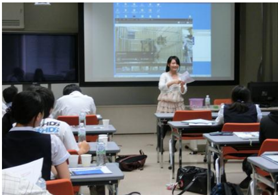
午前中に嗅いだペットボトルの中身の解説