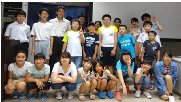
8月6日参加者と記念撮影