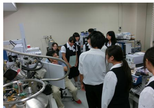
機械の説明を熱心に聴く受講生