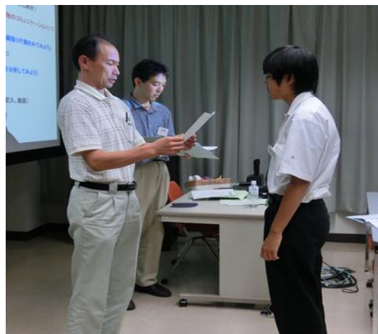
学振研究員から未来博士号の授与(8月7日)