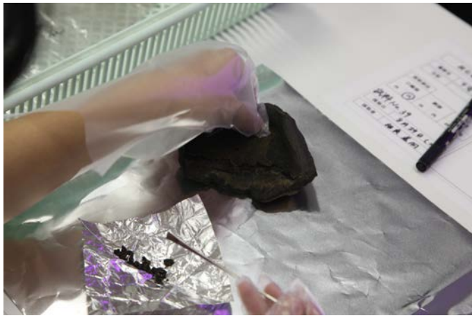
炭化物採取作業(2020 年度実施状況)