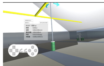
クレーンシミュレータ