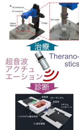
図1 超音波アクチュエーションのTheranosticsへの応用

従来研究されてきた超音波を用いた薬剤送達や生体診断の技術では、既存の医療用超音波デバイスを使用したものが一般的であり、デバイスに指定されたカタログスペックを逸脱した超音波の照射条件の利用は困難であった。本研究では、超音波の照射デバイスや用いる薬剤キャリアについても、独自に設計・製作することで照射する超音波条件に適したデバイスやマテリアルを開発することで、これまで困難であった効率向上に繋がる結果を得られた。