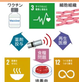
図3 本研究の将来展望

本研究で用いた超音波による薬剤送達技術では、注射することなく生体高分子の投与が可能である。これは、bFGFを始め、さまざまな薬剤の投与が期待できる。これらの特徴から安全性に期待ができ、発展途上国など注射の衛生管理が難しい地域での医薬品の投与が可能となる。また、生体組織の成熟度合いを超音波で測定する技術は再生医療や培養肉といった健康寿命の増加や食糧問題解決に貢献でき、今後はこれらを達成するための基礎検討をさらに実施していく。