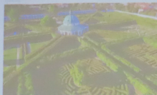
GARDENS IN KROMĚŘÍŽ