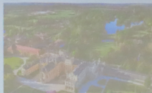
LEDNICE-VALTICE CULTURAL LANDSCAPE