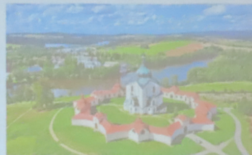
THE PILGRIMAGE CHURCH OF ST. JOHN OF NEPOMUK AT ZELENÁ HORA