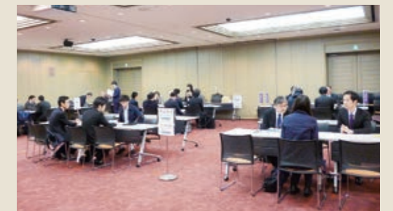
研究機関と若手研究者の交流