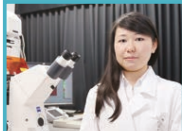
順天堂大学 大学院医学研究科ゲノム・ 再生医療センター 特任助教