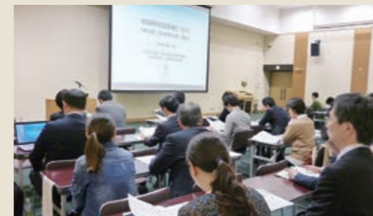
若手研究者向け公募説明会