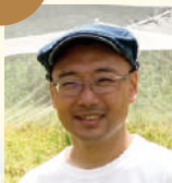
安達 俊輔 教授