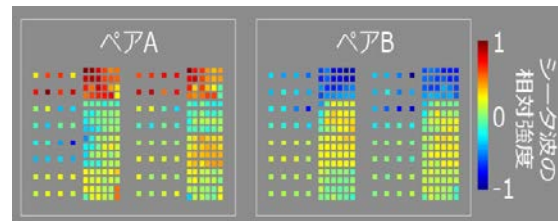
図3 ペアとして連想学習した図形は、内側側頭葉において類似したシータ波の空間パターンを生じるようになる