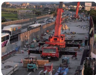
図2 供用中の高速道路等において、交通規制の短縮および高耐久性を実現するプレキャスト製品の開発