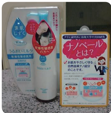
図2 キチンナノファイバーを配合した敏感肌用化粧品