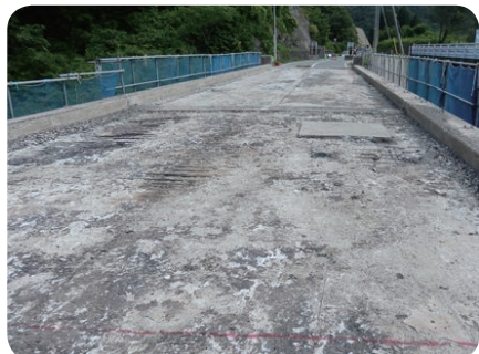
図1 道路橋床版の土砂化

主原料である高炉スラグは、天然物であるために環境調和性にも優れ、副産物であるために経済性にも富む特徴を有する。そのため、資源循環と構造物の長寿命化を両立させることが可能な本技術の更なる研究・開発を進めている。