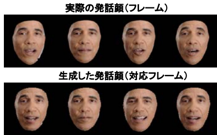
図 3 : 発話顔動画クローン

音声[2]、発話顔動画、全身動作動画、文書、ソーシャルメディアを対象とした MC 生成技術を具体化した。図 3、4、5 に示すように、生成ネットワークの他タスクに対する事前学習、他者の動作動画や肉筆の活用などにより、MC 生成対象人物の発話動画、全身画像、肉筆文字を少量与えたのみで、個人の特徴を再現した発話顔動画クローン、全身動作動画クローン、文書クローンが生成された。