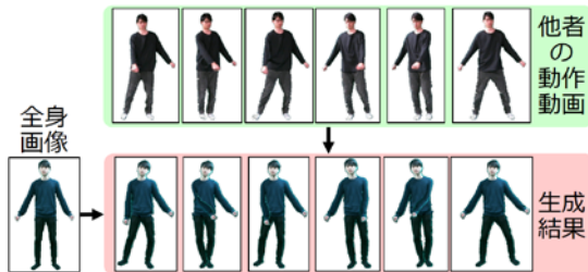
図 4 : 全身動作動画クローン