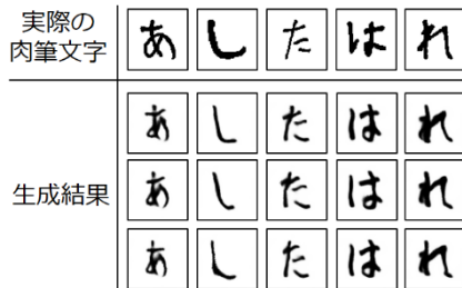
図 5 : 文書クローン