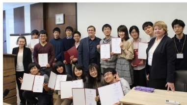
〈超短期派遣修了式:ノボシビルスク大学〉