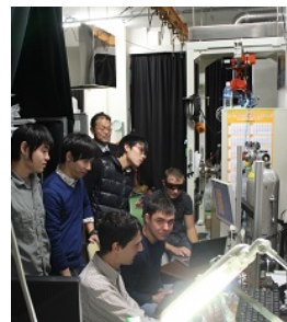
〈本学設置のジョイントラボでの学生指導:極東連邦大学と〉