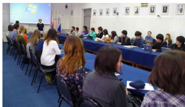
〈共修授業:モスクワ大学にて〉

昨年度ノボシビルスクで実施した異文化体験型学生交流プログラムの派遣事業を本年度はモスクワ大学で実施した。受入事業では、サマープログラムの他に専門科目プログラム(工学、心理学)も開発・実施した。高度な共同研究をベースにした教育研究型交流では、出前講座、オンラインゼミ、院生の短期派遣による共同教育を実施した。日露の教員と学生が参加し、モスクワ、ノボシビルスク、ウラジオストク、仙台を会場として開催された先端研究ジョイントセミナーは11回を数えた。モスクワ大学と共同開発中であるジョイントリー・スーパーバイズド・ディグリーシステムは来年度に承認され、運用開始の見込みである。