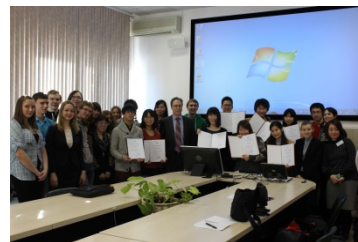
〈異文化体験型交流プログラム派遣プログラム修了証書授与〉