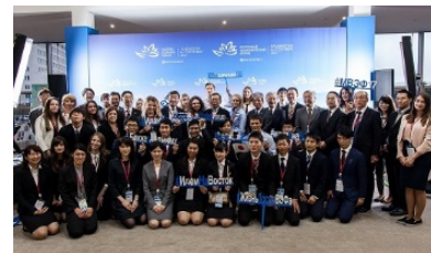
(日露学生フォーラム) 第3回東方経済フォーラムに合わせ ウラジオストクで開催