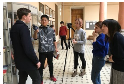
(異文化体験型交流プログラム) MSUジャーナリスト学部との共修授業