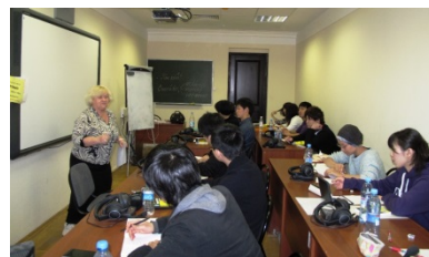
〈ロシア語研修の様子〉