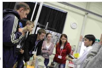
〈工学系ラボツアー〉