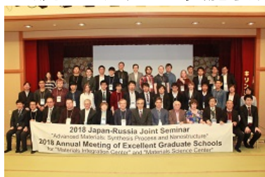
(材料科学ジョイントセミナー) NSUおよびSB RASとの共催