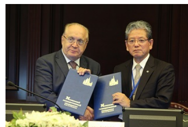
〈JSD協定締結:モスクワ大学〉