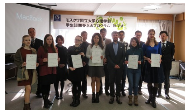
〈モスクワ大学心理学部短期留学修了式:文学研究科〉