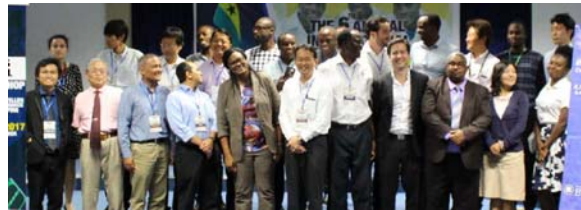
BIRDS ワークショップ(2017年11月ガーナ)

3世代 11 基の BIRDS 衛星が3年間のうちに打ち上げられ、その運用を各国で行い運用技術の共有を図ると共に、運用に携わる若手研究者の育成を行った。そのために、毎年1回の地上局ワークショップを九工大にて行い、企画・運営を九工大の大学院生が担った。