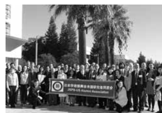
毎年全米各地で開催される同窓会シンポジウム・総会 (アメリカ) A U.S. alumni association's symposium and general meeting are held annually at various locations in the country (USA)