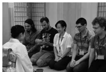
オリエンテーションでの茶道体験 Experiencing the tea ceremony at an orientation session