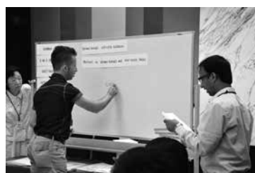
オリエンテーションでの日本語レッスン A Japanese lesson at an orientation session