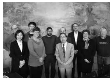
同窓会活動を支える JSPS スタッフ (デンマーク) JSPS staff members assist with alumni association activities (Denmark)