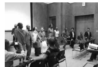
マサイオリンピックをテーマにしたユニークな同窓会ワークショップ (東アフリカ) A unique alumni association workshop on the theme of the Maasai Olympics (Eastern Africa)