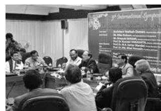
学術シンポジウムで活発に議論を交わす参加者達 (バングラデシュ) A lively discussion among participants at an academic symposium (Bangladesh)

URL https://www.jspss.go.jp/english/e-plaza/20_alumni.html