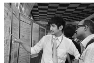
同窓会シンポジウムで若手研究者のためのポスター発表の場を提供 (インド) Providing a place for young researchers for poster presentations at an alumni association symposium (India)