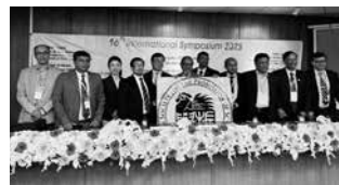
バングラデシュ同窓会第16回国際シンポジウム2025(バングラデシュ)

27th Japanese-German Symposium in Braunschweig held by Deutsche Gesellschaft der JSPS-Stipendiaten e.V. (Germany)