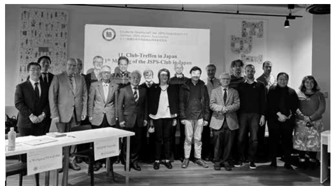
ドイツ語圏同窓会会員と同窓会活動を支える JSPS スタッフ (ドイツ) The German JSPS Alumni Association members and JSPS staff members supporting alumni association activities (Germany)