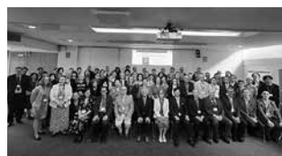
オックスフォードで行われたイギリス・アイルランド同窓会20周年記念イベント(イギリス)

URL https://www.jsps.go.jp/english/e-alumni/index.html