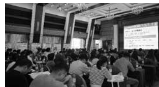
中国・ハルビン市で行われたJSPS中国同窓会の支部セミナー(中国)

16th International Symposium 2025 held by BJSPSAA (Bangladesh)