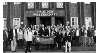
ブラウンシュヴァイクで行われた第27回日本・ドイツシンポジウム(ドイツ)

20th Anniversary Event of the JSPS Alumni Association for the UK and Republic of Ireland, Oxford (UK)