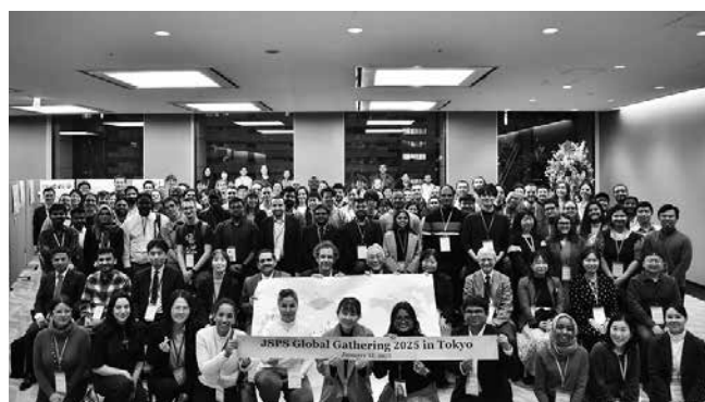
外特交流会 (JSPS Global Gathering 2025 in Tokyo) の開催 JSPS Global Gathering 2025 in Tokyo