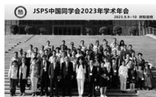
中国・フフホト市で行われたJSPS中国同窓会の年次総会(中国)

AA member talking her own experience at a JSPS booth of AAAS annual meeting (USA)