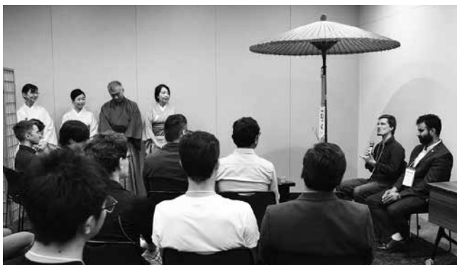
オリエンテーションでの茶道体験 Experiencing the tea ceremony at an orientation session