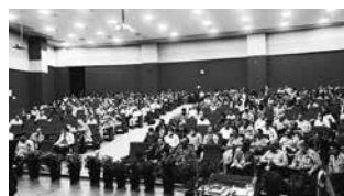
毎年インド全土の各支部で開催されるインド同窓会シンポジウム(インド)

URL https://www.jsps.go.jp/english/e-alumni/index.html