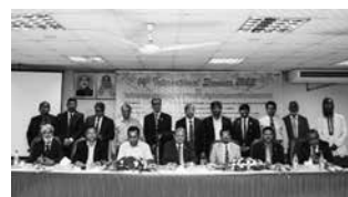
バングラデシュ同窓会第14回国際セミナー(バングラデシュ)

IJAA symposium held every year by each chapter (India)