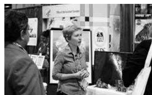
AAASの年次会合におけるJSPS事業のブースにて自らの経験を語る同窓会員(アメリカ)

14th international seminar held by BJSPSAA (Bangladesh)