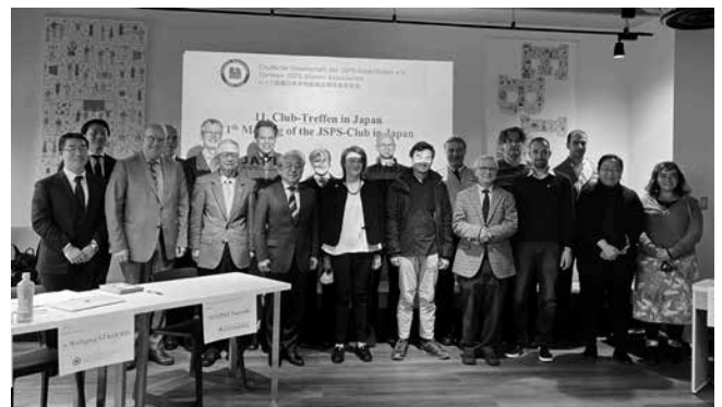
同窓会活動を支える JSPS スタッフ (ドイツ) JSPS staff members supporting alumni association activities (Germany)