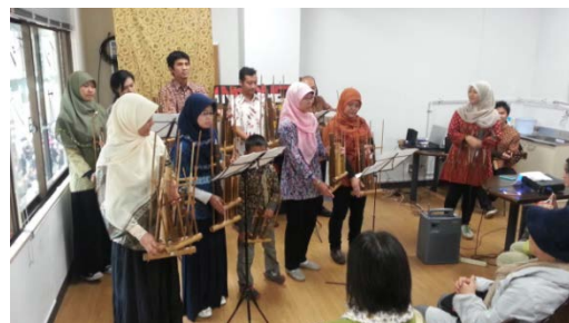
〈グローバルカフェでのミニコンサート〉