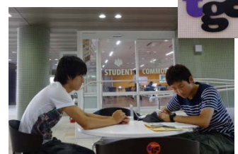
グローバルコモンズ