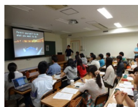
短期派遣学生の帰国報告会