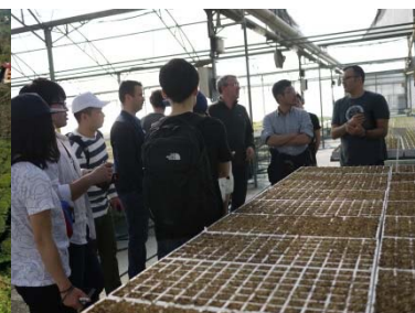
〈 派遣プログラム 〉 (グローバル農力養成プログラム)