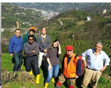
〈 派遣プログラム 〉 (グローバル防災・復興プログラム)