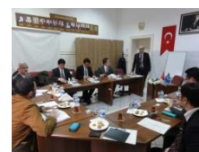
〈トルコ連携大学との協議〉