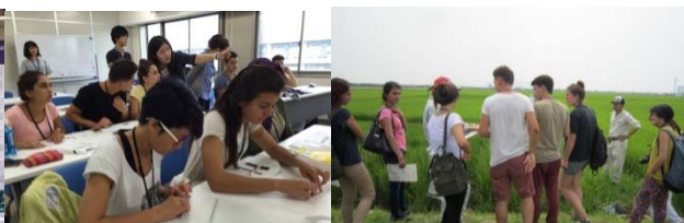
〈受入プログラムにおける学生の活動〉

平成28年度は、実質的な受入・派遣プログラム開始年度として、特に短期プログラムに注力した。トルコ国内の情勢によりトルコ本国への学生派遣は断念したが、トルコ人教員及びトルコ人学生の参加のもとで短期派遣プログラムを代替地にて実施し、本事業の目的達成を目指した。これら受入・派遣プログラムの実施により、新潟大学及び福島大学の学生はトルコ人学生との交流を通して国際感覚を身に付ける機会を得、長期留学や英語能力向上への強い意欲が醸成された。また新潟大学の発案で、大学の世界展開力強化事業(トルコ)の採択校と情報交換を行い、特に派遣時の学生の安全確保に関する情報を共有した。