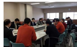
〈新潟大学で開催した事業推進打合せ〉

トルコ側連携大学とは大学間交流協定を既に締結している。加えてアンカラ大学とは、既存の協定で想定するよりも多くの学生の受入・派遣を本事業で実施することから本事業に特化した協定書を締結した。また、本事業の受入・派遣プログラムにおいて質の保証を維持するために、本事業で養成を目指す人材の目標に沿ったプログラム内容を実施した。さらに、福島大学とエーゲ大学、中東工科大学間においても新規に大学間交流協定を締結した。