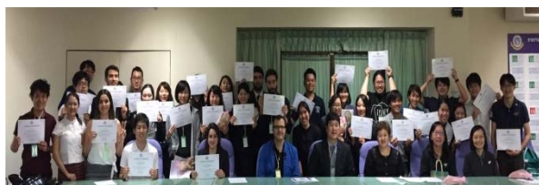
〈派遣プログラム修了時の集合写真〉