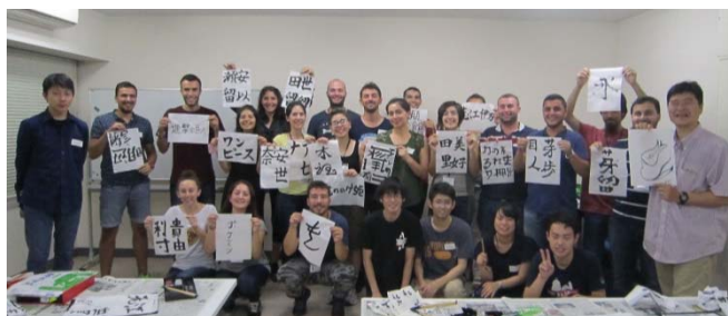
〈 受入プログラムにおける書道体験 〉