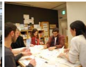
〈「とびらプロジェクト」への参画〉