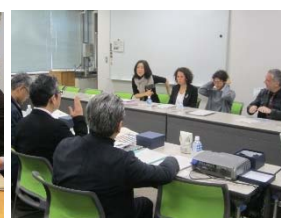
〈ミマール・シナン美術大学の教員を招聘し、学生交流計画の詳細を協議〉