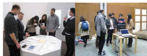
〈本学の卒業・修了制作作品展で制作者の学生と交流する連携大学の教員・学生〉

大学Webサイトにおいて本事業の概要、計画、将来ビジョンおよび個別の 活動レポートを日本語・英語の双方で公開 。連携大学の教員・学生による本学の卒業・修了制作作品展示会の鑑賞を実施。