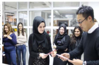
(アナドル大学でのワークショップの様子)

【受入】1名の学生が本学先端芸術表現科で授業を受け、滞在中には本学教員を取り上げた展覧会等にも参加した。陶芸専攻の学生2名が来日し、穴窯実習に参加した。本学取手校地で実施された紙すき拓本のレクチャーに絵画専攻の学生2名が参加した。