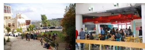
〈ベツアルエル美術デザインアカデミーのキャンパス〉

■ 外国人学生の受入及び日本人学生の派遣のための環境整備 コーディネーター、プロジェクト専門スタッフ、サポートスタッフを新規雇用・配置 。学生支援に係るネットワークの整備として、教職員がイスラエルに往訪した際に 派遣中の学生と面談し、現地の様子について聞き取り を行った。また、帰国留学生との連絡調整を実施したほか、 在イスラエル日本大使館スタッフとも面会 し、交流プログラムの支援について協議を実施。