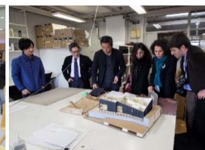
〈建築科アトリエでのレクチャー〉