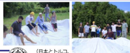
(日本とトルコ、両国の学生による共同作業)

【受入】2名の学生が来日し、オーストラリア・ボンド大学との日本の都市空間をテーマとしたワークショップに参加した。また彫刻科より2名の学生を受け入れ、本学学生と「彫刻と場について」をテーマとした合同ワークショップを実施した。