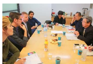
〈ベツアルエル美術デザインアカデミーにおける交流プログラムについての協議〉

本学の教職員が ベツアルエル美術デザインアカデミーに往訪 したほか、 連携3大学の教員を本学に招聘 し、交流プログラムについて詳細な打ち合わせを実施。産学連携については、陶芸工房や美術館のほか、 香川県 の文化振興課および 県立美術館長とインターンシップ等について協議 を行った。