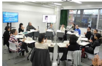
〈両校学生による公開型トークセッション〉

ファインアート分野の学生3名とデザイン分野の学生2名を受け入れ、 両校の学生5人ずつが英語による公開型トークセッションを開催 し、各自の作品・活動、それぞれの大学の相違などを語り合った。また、本学と東京都美術館が共同で実施している、アートを通じてコミュニティを育む事業「 とびらプロジェクト 」を訪れ、 イスラエルで同様に実施されている芸術に関する社会活動との比較等、活発な意見交換が行われた。