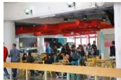
(ベツアルエル美術デザインアカデミーのキャンパス)

【受入】学生4名の長期受入を実施し、日本人学生と交流を深めつつ授業を受けた。夏には学生2名が、本学の学生とともに奈良を中心に日本の文化財を巡る古美術研究旅行に参加した。北欧の社会的デザイン(Societal Design)をテーマにしたフィンランドとの合同ワークショップに、3名の学生が参加した。