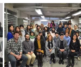
〈アナドール大学の教員・学生と東京藝術大学の陶芸研究室〉

■ 外国人学生の受入及び日本人学生の派遣のための環境整備 コーディネーター、プロジェクト専門スタッフ、サポートスタッフを新規雇用・配置 。学生支援に係るネットワークの整備として、教職員がイスラエルに往訪した際に 派遣中の学生と面談し、現地の様子について聞き取り を行った。また、帰国留学生との連絡調整を実施したほか、 在イスラエル日本大使館スタッフとも面会 し、交流プログラムの支援について協議を実施。