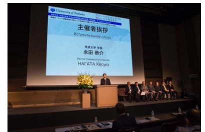
〈 キックオフシンポジウムの様子 〉

カザフ国立大学と本学との間で、大学間共通単位認定枠を盛り込んだ「 キャンパスインキャンパス 」構想の実現に向けた協力を両大学間で進めていく旨を記載した メモランダムを締結 した。