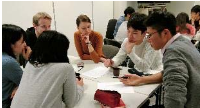
〈経済フォーラムにて、議論をする 日本・ロシアの学生。2018年2月〉