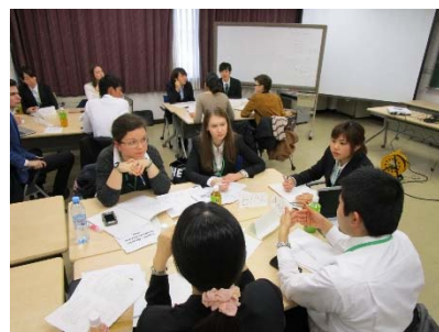
日露学生フォーラム2015で 討論する日本人・ロシア人学生 2015年12月