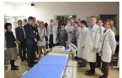
「地域医療に関する日露若手医療関係者交流」 (日露青年交流センター、新潟大学との共催) 平成29年2月

平成28年度、本プログラムの海外研修の一部を人文・文化学群「 海外プロジェクト研修 」(2単位)として科目開設した。医療視察研修についても、医学群医療科学類「 国際生命医科学実習 」(2単位)として単位認定されるようになった。平成27年度にはインターンシップ科目の単位化も始まり、より質の保証を伴った教育活動を実施できるようになった。