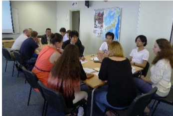
経済フォーラムでのディスカッション (モスクワにて) 平成28年6月