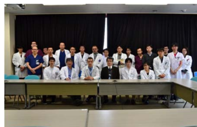
医療実務研修での受入学生と 本学附属病院のスタッフ

2016年5月より、医学群の学生2名がロシア国立研究医科大学で約1ヶ月の臨床研修を開始した。この研修は「海外医療実務研修」(11単位)の一環として単位が取得できる。