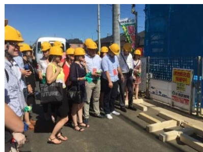
留学生を対象とした 国内インターンシップ 2015年7月

コーカサス諸国(アゼルバイジャン、アルメニア、ジョージア)およびモルドバの有力大学との交流開始を目指し、2015年12月に本学教員が各大学を訪問し協議。このうちアゼルバイジャン言語大学、トビリシ自由大学(ジョージア)、ロシア・アルメニア・スラヴ大学(アルメニア)と大学間交流協定を締結。モルドバの大学とも平成28年度に協定を締結し、交流を開始する予定である。