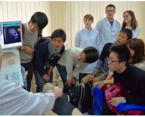
〈 海外研修の様子 〉