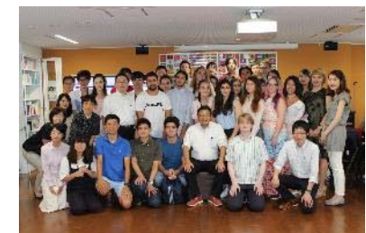
〈受入プログラム修了式。2017年8月。 筑波大学〉