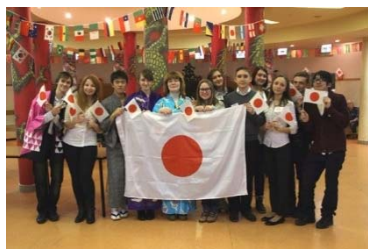
派遣学生とロシア人学生の交流 (モスクワにて)