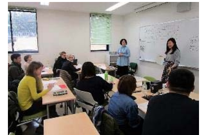
〈日本語・日本文化研修。2017年12月。 筑波大学〉