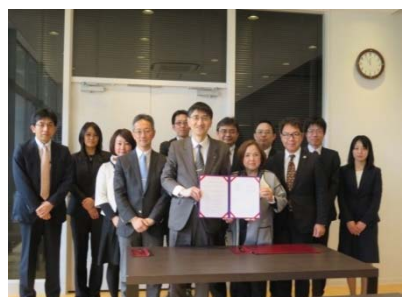
東北大学との協定締結 平成29年3月

平成28年5月、本事業の 中間成果報告会 を実施した。同時に「中間成果報告書」を作成し、内外に成果の発信を行った。