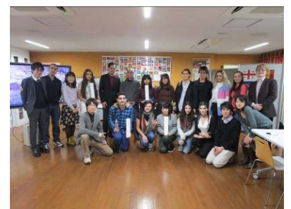
日本語・日本文化研修 平成28年12月

コーカサス諸国(アゼルバイジャン、アルメニア、ジョージア)およびモルドバの有力大学 であるADA大学、アゼルバイジャン言語大学(以上アゼルバイジャン)、トビリシ自由大学(ジョージア)、ロシア・アルメニア・スラヴ大学(アルメニア)、モルドバ国立大学と大学間交流協定を締結した。これによりロシア語圏諸国との教育交流の環境が大きく向上した。平成28年12月には、上記 5カ国の日本語教師、日本語学習者を対象とした日本語・日本文化研修 を実施した。