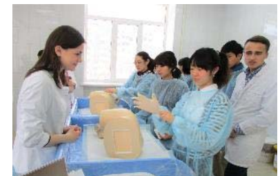
〈医療視察研修。2018年3月。 ノボシビルスク国立医科大学〉