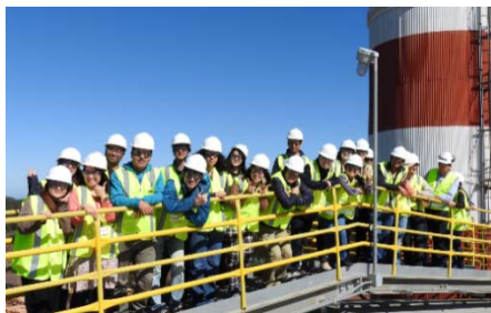
〈チリの木材産業に関する研修〉