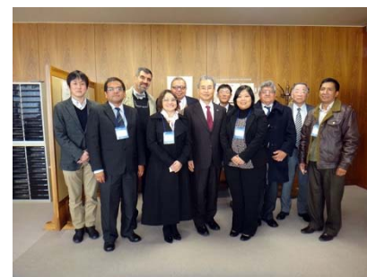
〈2017年1月DTP担当者会議・山形〉

全ての長期受入学生に対して日本語教育の他、インターンシップを実施した。また日本企業への就職を希望する者には、ビジネス関連科目を開講している。派遣学生に対してはスペイン語教育の他、現地の状況を説明する事前学習会を行った。