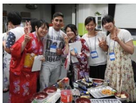
〈2016年7月短期受入・米沢〉

短期・長期とも派遣・受入で計画を上回る合計21名の学生が参加した。日本ではスペイン語講座、アンデス諸国では山形大学主催の日本語講座を開設し、それぞれ1年間の語学教育を修了した者が短期プログラムに参加する体制が整った。カトリカ大学との間ではダブル・ディグリー制度構築に向けての準備協定書を締結し、協議を開始した。