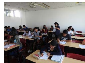
〈2018年2月〉日本語集中講座・ペルー・リマ

参加条件としての日本語・スペイン語の履修条件を強化した。11月ペルー・リマで協定5校教職員と「第2回担当者会議」を行った(チリは別途訪問)。2月ボリビア・チリの日本語教員をペルーに召集して「日本語教師トレーニング・セミナー」を開催した。ペルー・カトリカ大学との間では考古学・人類学分野でダブル・ディグリー制度を確立すべく、協議を進めている。