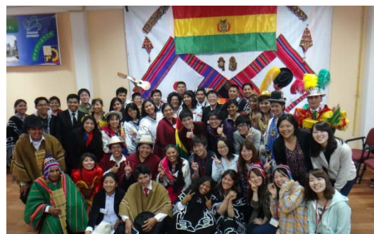
〈サンアンドレス大学における学生交流〉

学生の短期派遣に関しては、書類選考と面接試験により28名の応募者のなかから、学業成績、語学力、学習意欲を基準にして13名の優秀な派遣学生を決定した。山形大学におけるスペイン語教育、南米3カ国での日本語基礎教育も開始した。ペルーのカトリカ大学との間で、ダブルディグリー制度構築のための準備協定書を締結した。