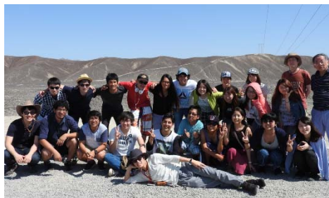
〈ナスカ研究所における研修〉