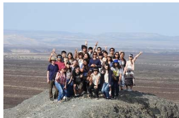
〈2018年2月短期派遣・ペルー・ナスカ〉

派遣13名(長期2名、短期11名)・受入13名(長期3名、短期10名)計26名の交換留学を実施した。学内外でプログラムが認知されるにともない、申請者数は増加しており、参加者の日西の語学力・留学先への長期的な関心も高まっている。長期学生は留学先で言語学習を継続し、専門科目の単位を修得した他、現地で開講しているスペイン語・日本語講座に補佐として参加した。また長期受入では帰国前に山形県内企業で全員がインターンシップを経験した。短期派遣ではペルーとボリビアで現地学生と合宿型研修を行い、短期受入では日本人学生が一部計画に作成段階から参与した。