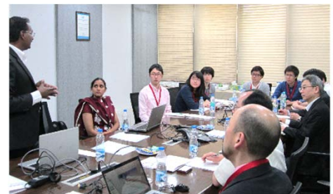
〈バンガロールでの企業視察〉