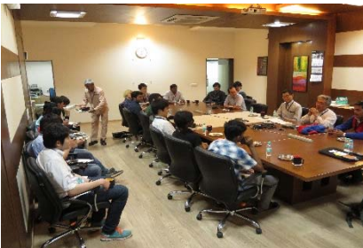
〈インドでのワークショップ〉

○日印双方で開催する国際ワークショップ・セミナーへの参加を目的とした短期の相互学生交流、特別学修生制度による相手校の学部学生の受入及び協働教育研究指導による1～3か月程度の相互学生交流を実施した。