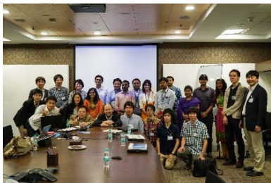
〈バンガロールでの企業視察〉

○日印双方で国際ワークショップやセミナー等を開催し、学生の相互交流を行った。特にインド(バンガロール)で開催したワークショップでは、日本人学生による現地進出企業の視察を併せて実施し、インド進出についての課題等について直接現地企業担当者から話を聞く機会を設けた。