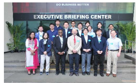
〈バンガロールでの企業視察〉