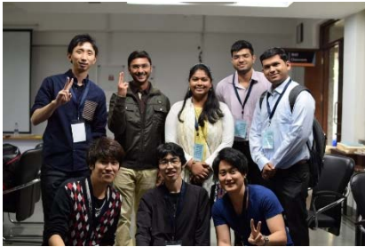
〈インドでのセミナー〉

○日印双方で開催する国際セミナーへの参加を目的とした短期の相互学生交流、特別学修生制度による相手校の学部学生の受入及び協働教育研究指導による2~3か月程度の相互学生交流を実施した。