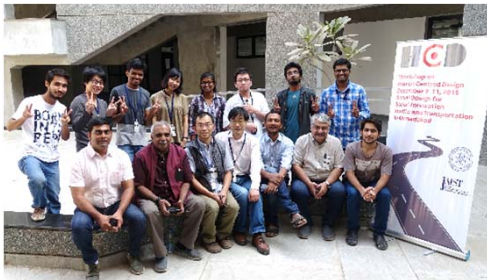
〈インドでのワークショップ〉

○日印双方で開催する国際ワークショップ・セミナーへの参加を目的とした短期の相互学生交流、特別学修生制度による相手校の学部学生の受入を継続するとともに、協働教育研究指導による1～3か月程度の相互学生交流を開始した。