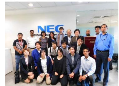
〈バンガロールでの企業視察〉