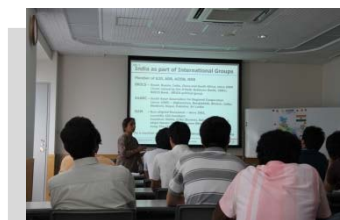
〈インド人教員によるインド派遣前ガイダンス〉