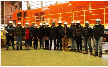
〈短期受入プログラムにおける日本企業見学〉

・本学、海外相手大学(インド工科大学マドラス校および インド情報・設計・生産技術大学カーンチプラム校)、企業との三者間協定の締結により学生の海外長期インターンシップ(実務訓練)先の充実を図った。平成29年度は、前年度に協定を締結した新規企業に日本人学生を派遣した。また、新たに日本企業とインド人学生受入に係る三者間協定を締結した。