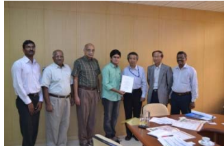
〈三者間協定に基づく留学生に修了証の授与〉

平成27年度は、インド工科大学マドラス校及びインド情報・設計・生産技術大学カーンチプラム校との間で、単位互換制度及びジョイントディグリー・プログラム構築に向けた調整を行った。