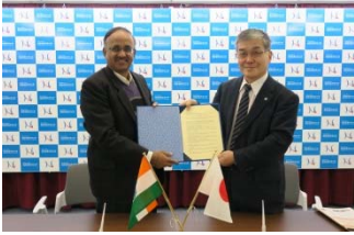
〈本学とIIITD&M 双方の学長による 単位互換協定調印式〉

平成28年度は、インド工科大学マドラス校(IITM)及びインド情報・設計・生産技術大学カーンチプラム校(IIITD&M)との間で単位互換協定を締結し、ダブルディグリー・プログラム構築に向けた調整を進めた。