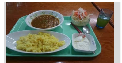
〈ベジタリアンメニューの例〉