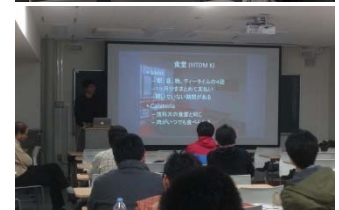
〈インド留学を経験した先輩による 体験報告会・インド派遣前ガイダンス〉