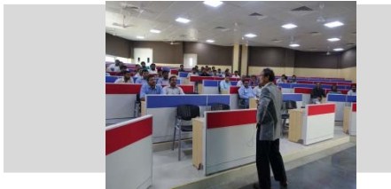
〈本学教員による連携大学での講義〉

平成26年度は、本構想の骨子となる質の保証を伴う単位互換制度の確立に向け、教員の相互交流、学生の相互派遣を行い、質保証を伴う単位互換制度及びジョイントディグリー・プログラムの設置、相手国での長期インターンシップ制度の確立に向けた調整を行った。