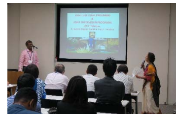
〈日印共同セミナーにおける講演〉