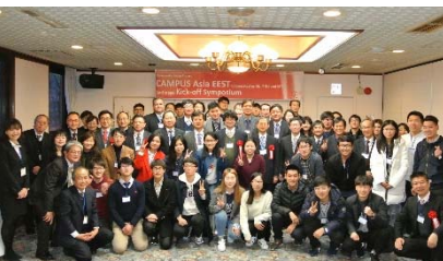
〈キックオフシンポジウム 九州大学 2017/2/22〉