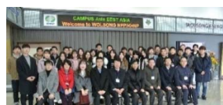
スプリングセミナー(釜山大学校)