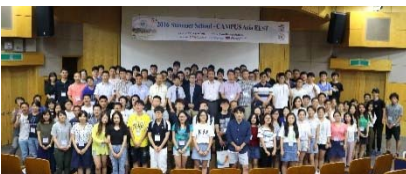
〈サマースクール 釜山大学校 2016/8/16~8/26〉

◆スプリングセミナー、校外学習(九州大学) キックオフシンポジウム終了後、水俣、鹿児島地方への校外学習を実施。2泊3日に亘り、エネルギー環境理工学に関する学習を実施。