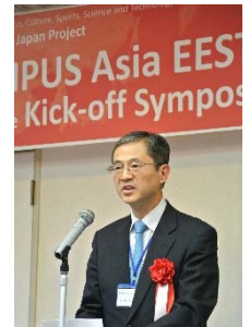
〈キックオフシンポジウム MEXT田浦分析官によるご挨拶〉