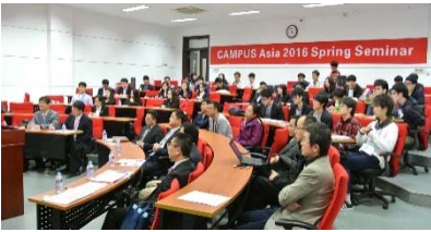
〈スプリングセミナー 上海交通大学 2016/4/26~4/28〉

◆スプリングセミナー(上海交通大学) 上海交通大学開学120周年の記念行事として開催されたスプリングセミナーへ参加。