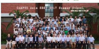
サマースクール(上海交通大学)