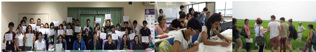
〈派遣プログラム修了時の集合写真〉