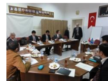
〈トルコ連携大学との協議〉