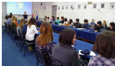
〈共修授業:モスクワ大学にて〉

昨年度ノボシビルスクで実施した異文化体験型学生交流プログラムの派遣事業を本年度はモスクワ大学で実施した。受入事業では、サマープログラムの他に専門科目プログラム(工学、心理学)も開発・実施した。高度な共同研究をベースにした教育研究型交流では、出前講座、オンラインゼミ、院生の短期派遣による共同教育を実施した。日露の教員と学生が参加し、モスクワ、ノボシビルスク、ウラジオストク、仙台を会場として開催された先端研究ジョイントセミナーは11回を数えた。モスクワ大学と共同開発中であるジョイントリー・スーパーバイズド・ディグリーシステムは来年度に承認され、運用開始の見込みである。