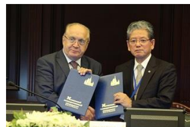
〈JSD協定締結:モスクワ大学〉