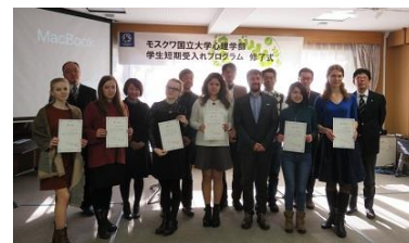
〈モスクワ大学心理学部短期留学修了式:文学研究科〉