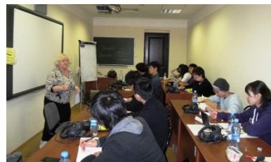
〈ロシア語研修の様子〉