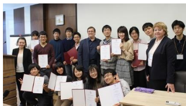
〈超短期派遣修了式:ノボシビルスク大学〉