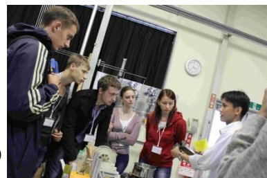
〈工学系ラボツアー〉