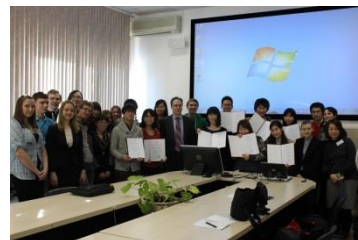
〈異文化体験型交流プログラム派遣プログラム修了証書授与〉