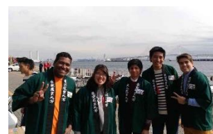
〈株式会社メルカード東京農大でインターンシップ〉