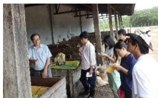
〈トマス総合農業協同組合で インターンシップ、ブラジル〉