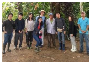
〈ブラジル派遣学生6名と引率者が パラ州にあるトメアス農協を見学〉

本年度は、事業コーディネーター採択、プログラム構築、受入大学等との連絡調整、学生募集とプログラム実施、成果報告会開催を短期間で実施したにもかかわらず、完遂することができた。本事業が目指す中南米で活躍できる人材を育成する派遣・受入プログラムとして組み込んだ5大要素(①専門科目受講、②現地語研修、③現地学生との交流、④農学系インターンシップ、⑤農業・農学関連施設見学)を盛り込むことができた。特に、④農学系インターンシップ実施は、派遣プログラムでは海外支部校友会及び関係者の調整と受入先引受(ブラジル・トメアス農協、ペルー・カムカム協会、メキシコ鈴木農場)において、受入プログラムでは大学発学生ベンチャー企業(株)メルカード東京農大、地域連携協定締結自治体の長野県長和町において、実学的な取組目標を達成した。