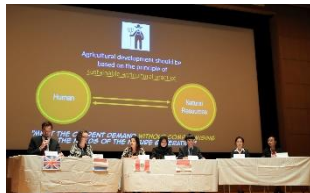
〈世界学生サミット〉

協定校: サンパウロ大学(ブラジル)、アマゾニア農業大学(ブラジル)、ラ・モリーナ国立農業大学(ペルー)、チャピング自治大学(メキシコ)