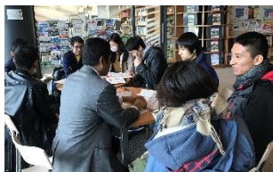
〈ラテン・アメリカンカフェ〉