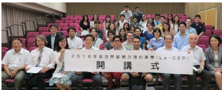
〈2016年度 3大学協働 受入プログラム開講式〉

派遣・受入ともに、「短期型・異分野交流プログラム」「中期型・地域理解プログラム」の2プログラムを実施した。各プログラムは①3大学合同での事前教育 ②各大学でのラボワーク・コースワーク、フィールドワーク ③インターンシップ(短期型は企業訪問) ④3大学合同での留学成果報告会 等から成り、派遣学生と受入学生の交流及び文理を超えた学生交流を行うことにより、3大学協働「トリプレット」の効果を最大限発揮しながら、留学プログラムを推進することができた。