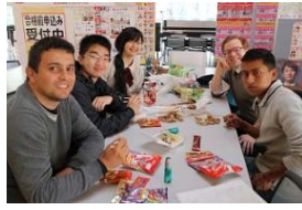
タンデムラーニングの様子