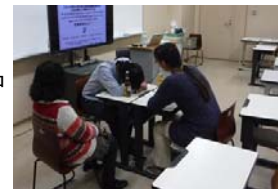
〈危機管理セミナー(睡眠薬強盗の実演)〉