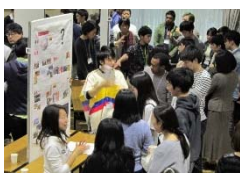
〈多摩地区合同コキウムでの留学成果報告〉