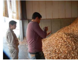
山梨県内ウッドペレット 工場の視察