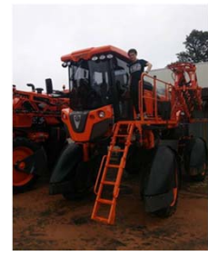
JACTO社(ブラジル)で のインターンシップ