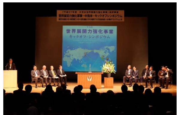
キックオフシンポジウムの様子