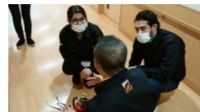
〈インターン先企業で防災設備点検についての説明を受ける学生〉

ホームページやFacebook上で各種事業の報告を随時行っているほか、事業概要を掲載するホームページの多言語化(英語・スペイン語・ポルトガル語)を進めている。また、受入学生のインターンシップについての様子がテレビ番組で放映されるなど、一般市民にも本事業について広く周知する機会が得られた。