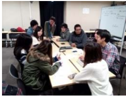
日本人学生とバディ 学生の合同授業