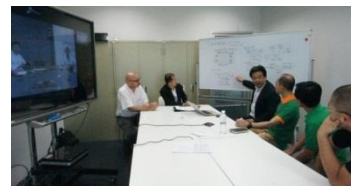
共創FDワークショップ試行時の様子 (チュロンコン大学、ラオス国立大学)

なお、平成28年度は受入プログラムとして、理工学部及び理工学研究科がタイ・チュロンコン大学から4名、シンガポール国立大学から2名を受入れている。