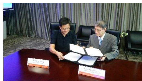
〈交流継続協定調印式 シンガポール国立大学にて〉

平成29年度にはベトナム、カンボジア、ミャンマー、シンガポールから学生の受入を行うことを、平成28年度中の交渉により既に決定している。