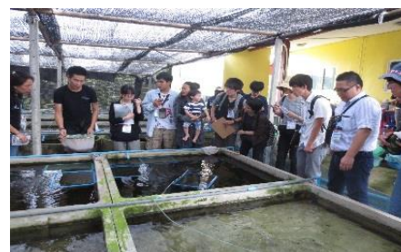
〈カンボジアでのフィールドワーク〉

参加学生は異国の農業を実際に目にする事で、農学に関する専門的知識を身につけた。研修中に訪問国の同年代の学生と英語で討論し、文化の異なる背景をもつ外国人学生との共同作業の経験を積み、国際的な視野が育まれた。グループワークでは、計画立案や成果の取りまとめの討論を通じて協調性を養うとともに、相手の意見をよく聴いて成果をまとめ上げるチーム力・相互理解力を身につけた。